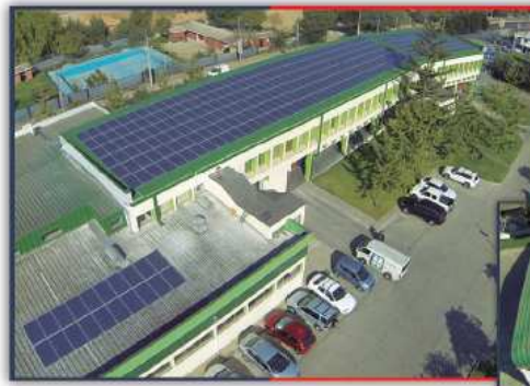
Planta Productiva de Knop Laboratorios en la ciudad de Quilpué.

Knop Laboratorios , ha sido una de las empresas pioneras en apostar por Energías Renovables, instalando Paneles de Energía Solar en su planta productiva , ubicada en la ciudad de Quilpué.